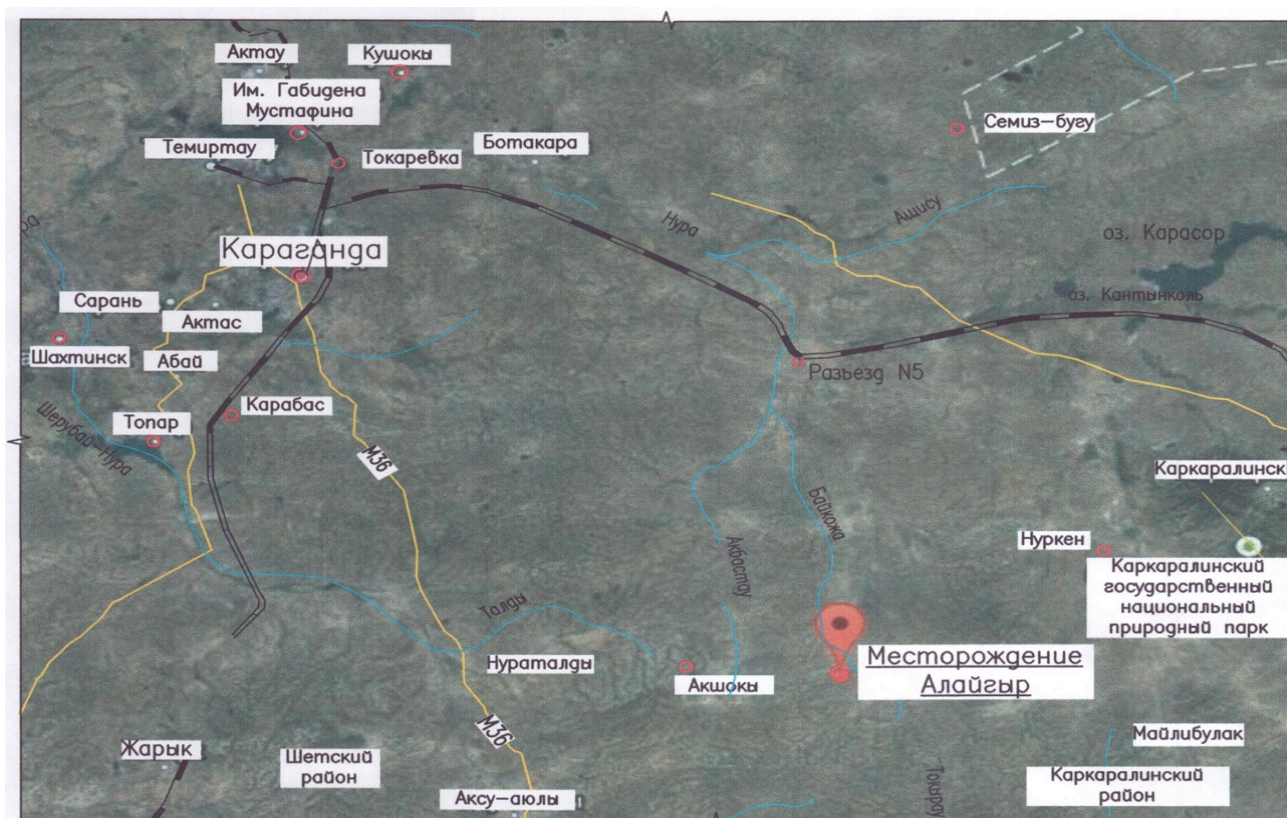
Рисунок 1. Месторасположение месторождения Алайгыр

Месторождение Алайгыр находится на расстоянии 240 км от г. Караганды. В административном плане часть месторождения относится к Шетскому району и часть к Каркаралинскому району.